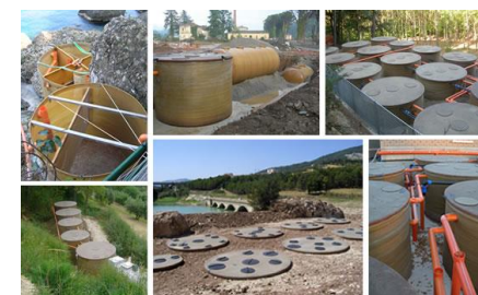
Impianti di depurazione