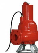
Elettropompe sommergibili per acque reflue e drenaggio