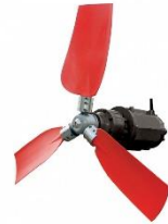
Acceleratori di flusso