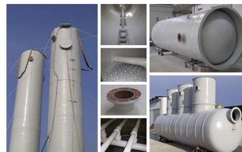
Serbatoi per acqua