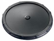
Diffusori a piattello 9" e 12"