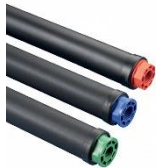
Diffusori tubolari 500 - 750 - 1000 mm