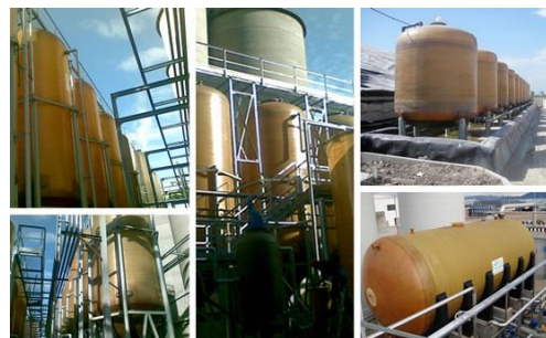
Serbatoi per l'industria