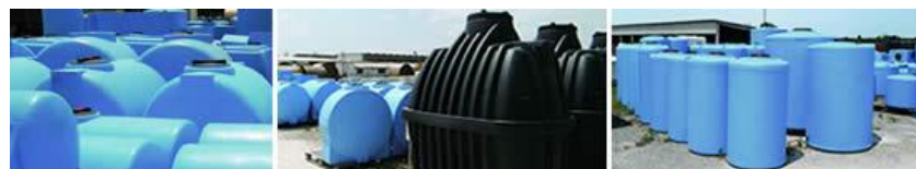
Serbatoi in polietilene