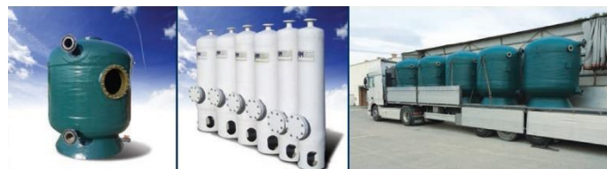
Filtri in pressione