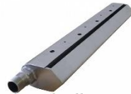
Diffusori a bolle grosse