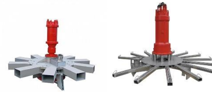
Aeratori pressurizzati e auto aspiranti