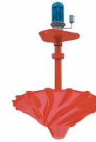
Aeratori di superficie